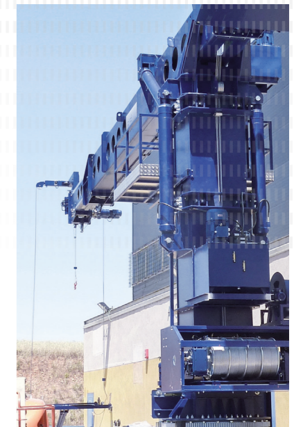
Sicher in jeder Höhe NORD-Antriebstechnik verfährt die Gondel sanft und positioniert sie präzise

Zugang zu allen Seiten. – Zudem greifen zwei Stirnradgetriebe in einen Getriebering, um die komplette Maschine zu drehen, so dass die Gondel auf jeder Seite des Gebäudes eingesetzt werden kann. Ein weiterer SK 500E dämpft hier das Anfahren und Anhalten der Gondel und ermöglicht unterschiedliche Drehgeschwindigkeiten.